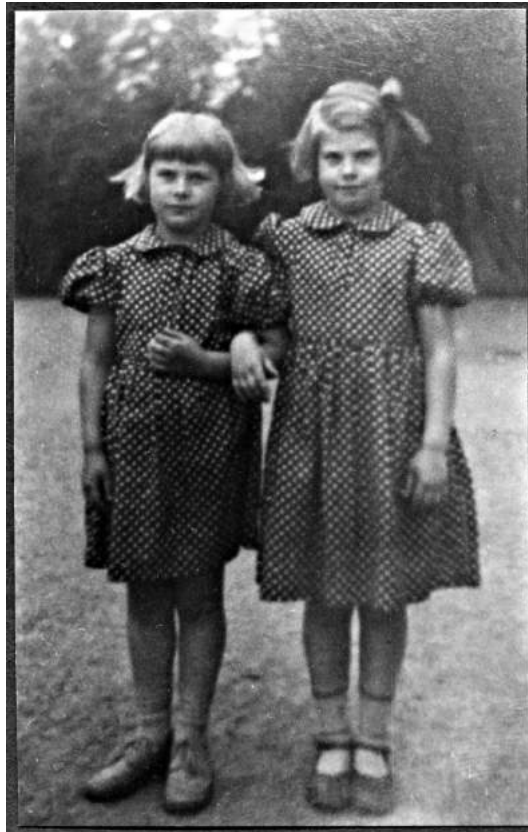
Kilde: Friheten 2002 v/Tor Inge Berger Foto: Privat