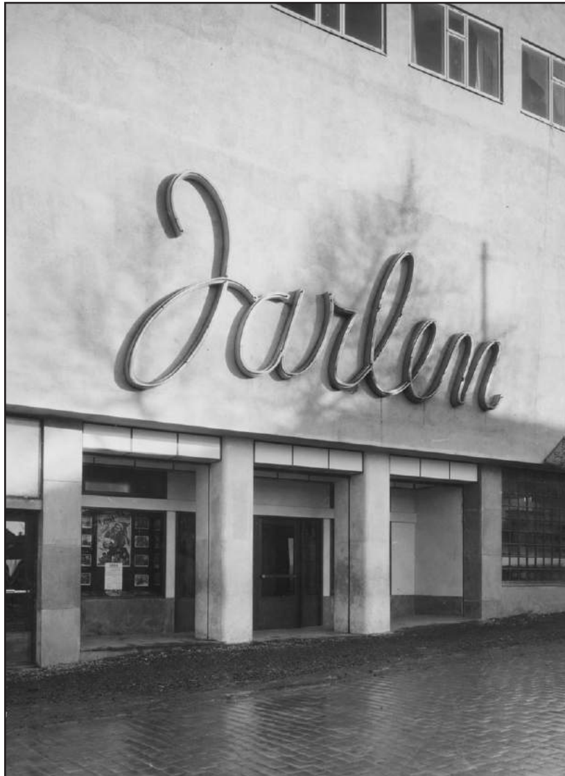
Jarlen Kino i Åkebergveien 56. Innviet 11.1.1938 - Stengt 8.12.1988

kampen historielag ETABLERT OKTOBER 1986