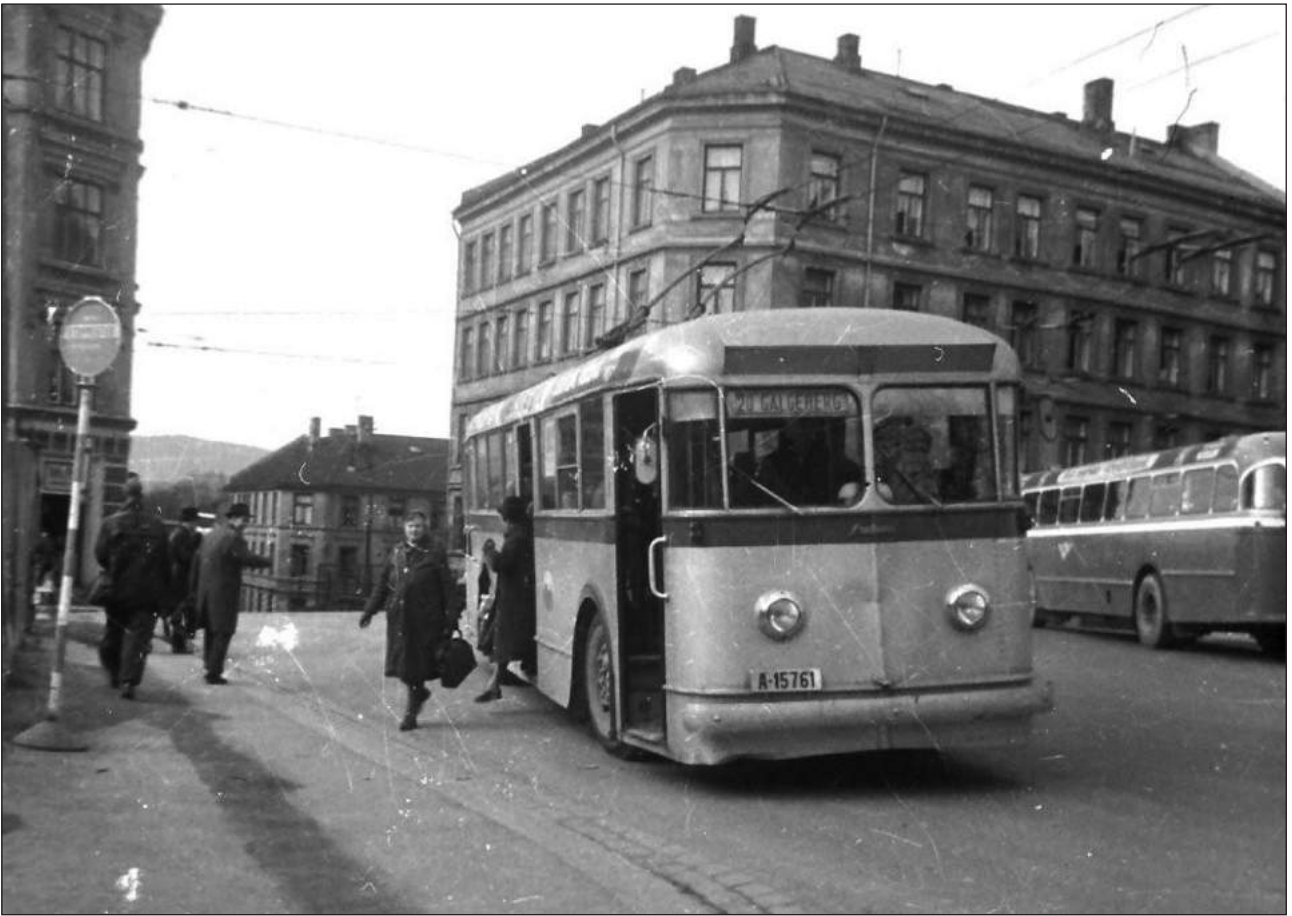
Stoppsted på Sørli plass