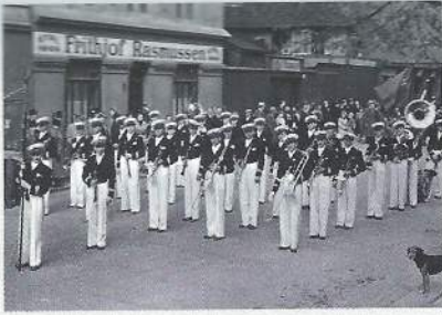
Bildet viser «Kampegutta» i Stenersgata 1. mai 1938 eller 1939. Huset bak på bildet står ennå.