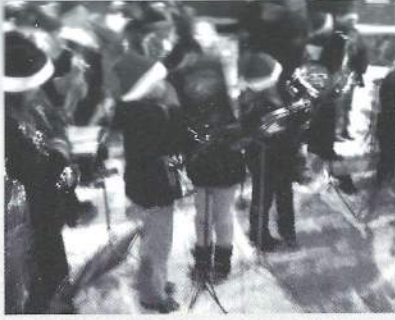
Fast akkompagnement er blant annet Kampen Skoles musikkorps.