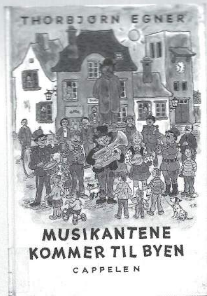
Thorbjørn Egners egen illustrasjon til forsiden av boken «Musikantene kommer til byen».

T HORBJØRN EGNER ble født i 1912 og hadde en eldre søster og en bror. Familien bodde i Normannsgata 5 og hadde kolonial i første etasje. Bestefaren og en onkel hadde dessuten kolonialbutikker andre steder i byen.