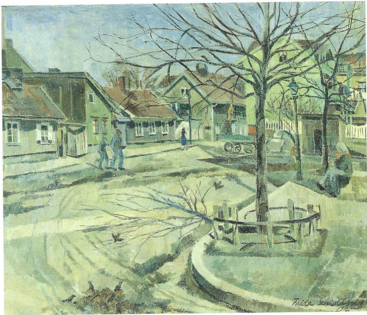
FRIDA SCHIOLDBORG: Plassen foran Kampen kirke 1920