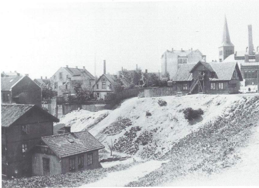
ELVERUMGATEN BAK TIL HØYRE. FOTO: PRIVAT EIE