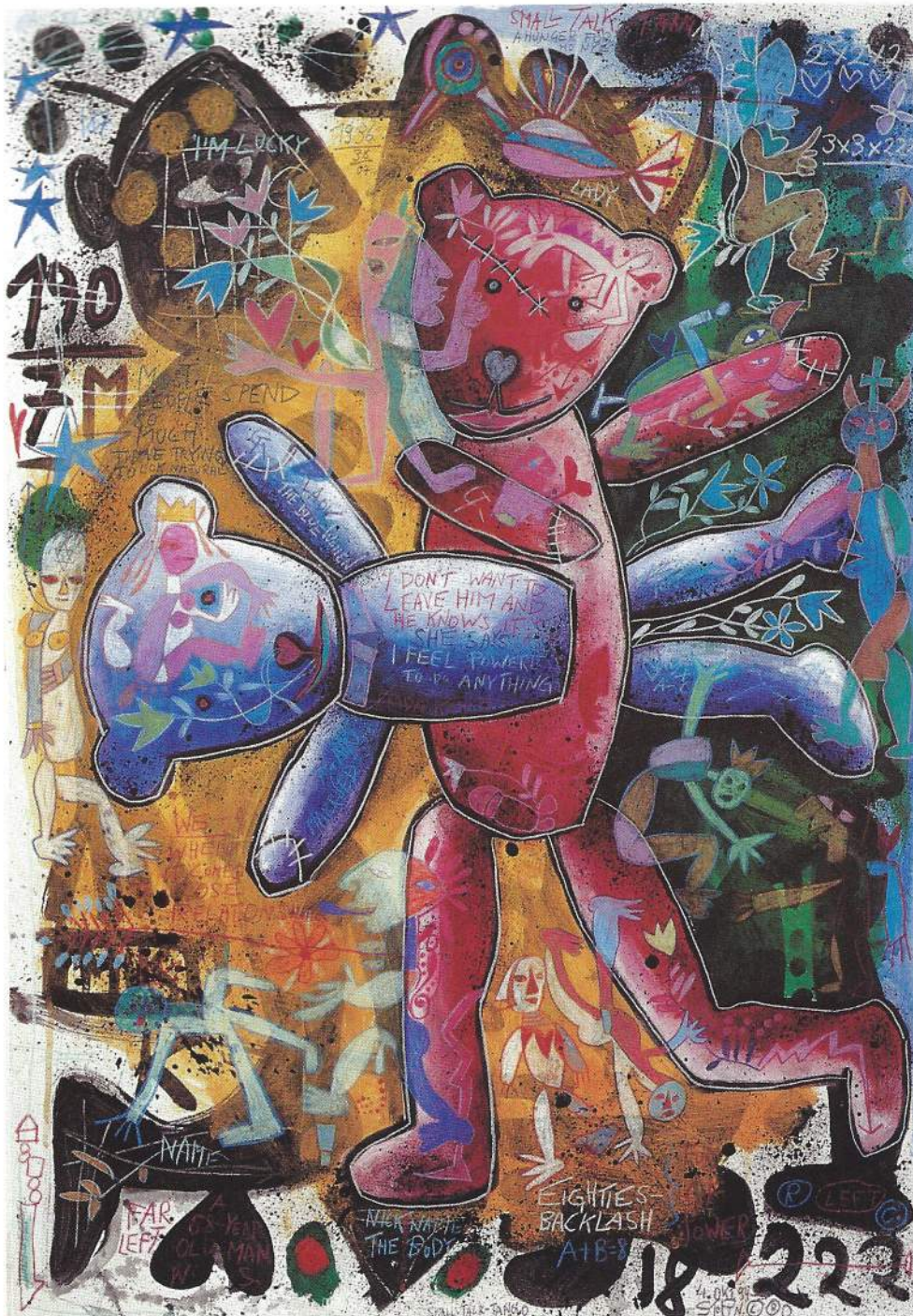
Willibald Storn: Teddybjørner